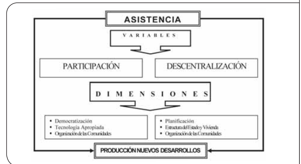
Gráfico 1: Asistencia técnica como proceso divulgativo en la producción de nuevos desarrollos habitacionales.

Es así que se puede entender la asistencia técnica como un proceso divulgativo de asesoramiento y capacitación hacia los individuos de una comunidad o al gobierno local que propicie la participación, la planificación e interacción en la producción de la vivienda. Se propone para dicho proceso la intervención de profesionales individuales o dentro de organizaciones no gubernamentales que por medio de estrategias, programas y acciones concretas impartan sus conocimientos ayudando de esta manera al mejoramiento del hábitat. Una vez conocidos actores y relaciones funcionales de la asistencia técnica se hace necesario manejar su interrelación creando un escenario que permita desarrollar políticas de viviendas acertadas, conectadas a la descentralización y participación logrando una buena conexión entre los actores para la producción de los nuevos desarrollos habitacionales como se expresa en el Gráfico 1