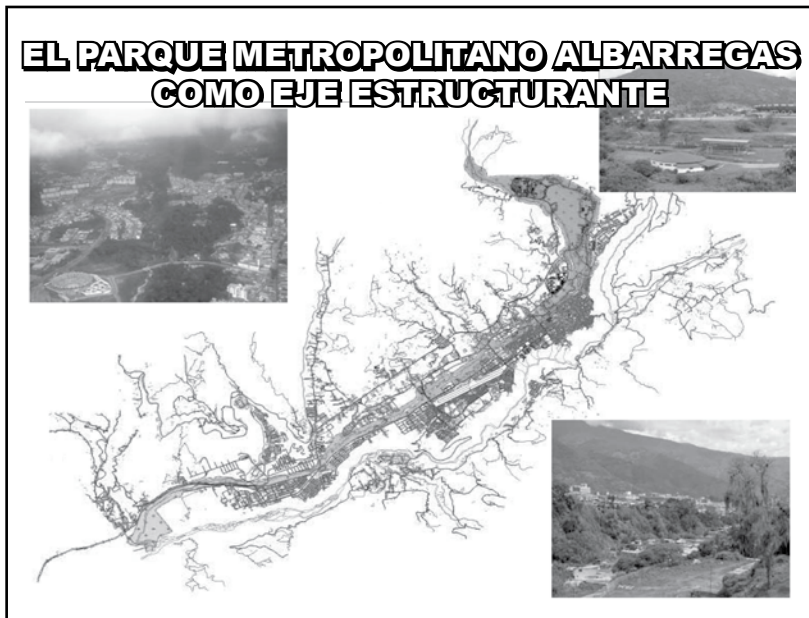
Figura 1. El Parque Metropolitano Albarregas

El diseño y desarrollo de este “frente de agua” urbano (Rangel, 2.003), se ha reconocido debe ser un mecanismo valioso para propiciar el desarrollo sustentable de la ciudad de Mérida, por ser un eje ambiental múltiple, de convergencia entre dos ecosistemas intensamente complejos y difíciles de manejar en conjunto: el ecosistema natural del río y el dinámico ecosistema urbano del par Mérida-Ejido con el cual se relaciona.